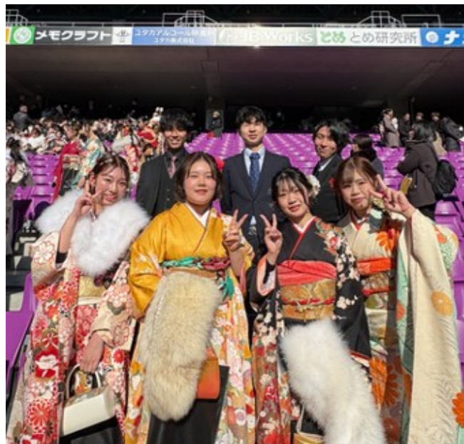
令和8年1月12日サンガスタジアムにて

町内の7人の方からそれぞれの思いや抱負を寄せていただきましたので紹介いたします。