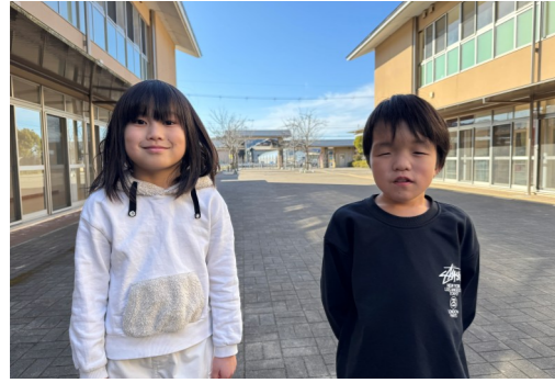
亀岡川東学園の2年生2名に聞きました。