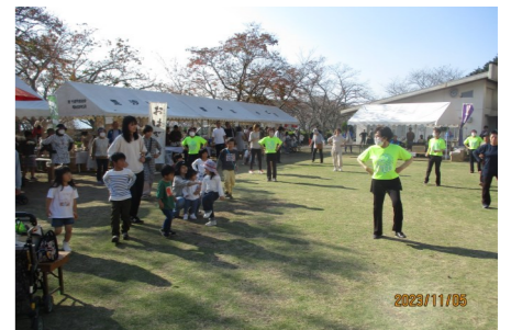
みんなで体操 3B体操