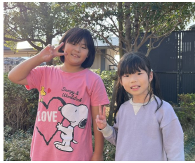
亀岡川東学園の2年生2名に聞きました。