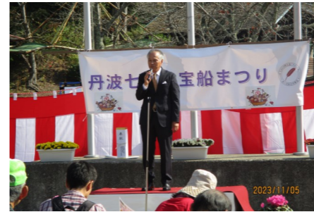
オープニング 自治会長挨拶

錦秋の候ではありましたが晴天夏日の11月5日、七谷川野外活動センターで4年振りに「ふれあい」をテーマに開催された第30回丹波七福神宝船祭り2023が、500名近い来場者によりにぎわいました。行列のできる食のコーナーや、朝取り地場野菜や花の販売、また風情のあるお抹茶の席など、色々趣向を凝らしたお祭りに終日子どもたちの歓声が会場に響きわたりました。(文：主原良一)