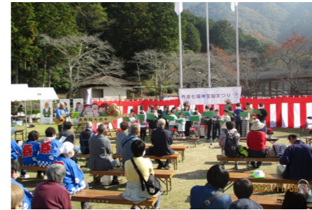
オープニング 子ども達の歌声