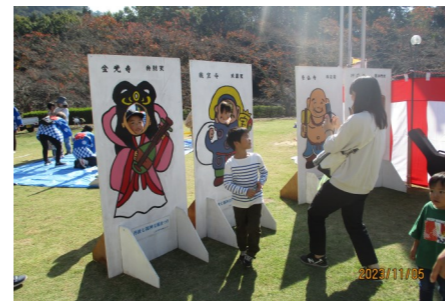
七福神顔出しパネル